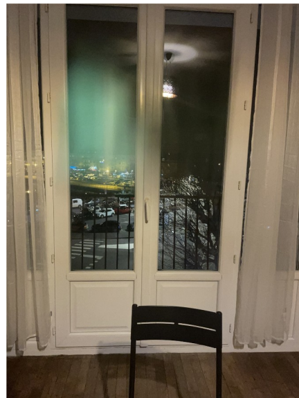
Sans lumière et faible exposition