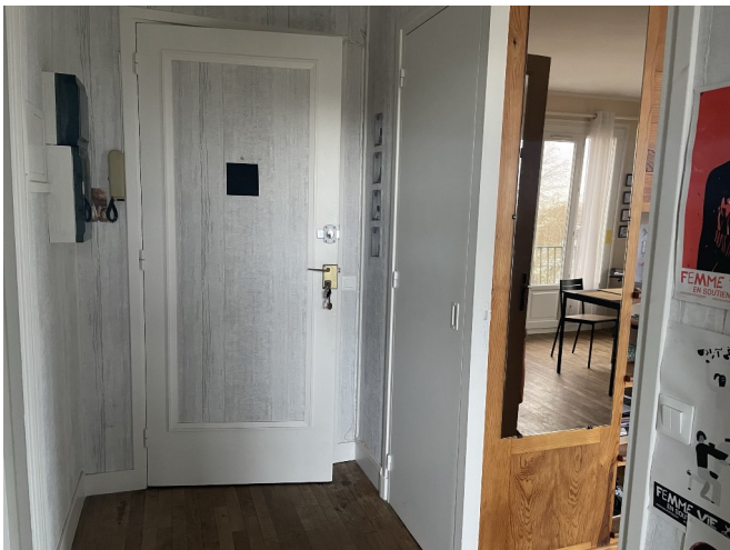
Entrée de l'appartement