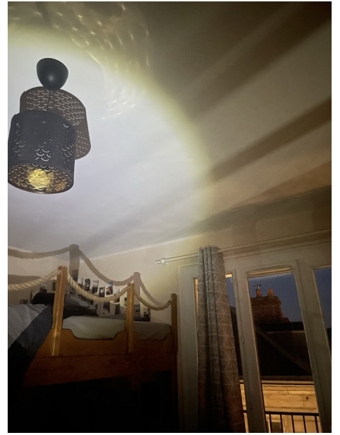
Puissance de la lampe, différence lumière lampe/fenêtre