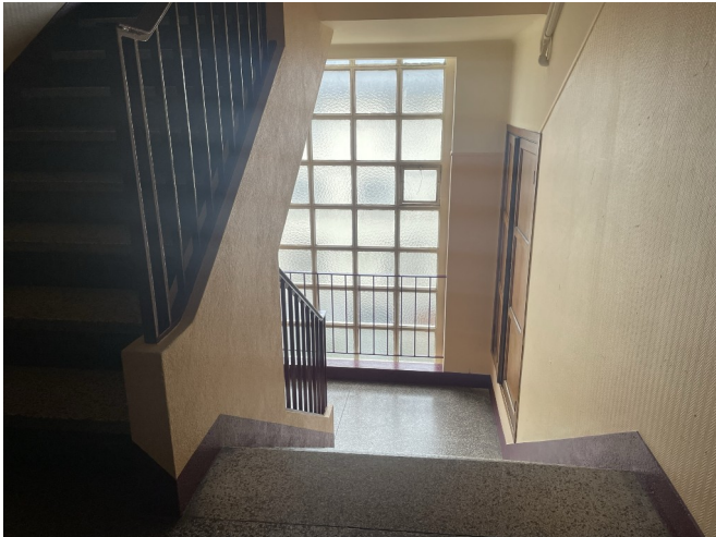
Escalier de l'immeuble